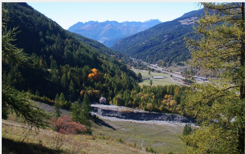
La vallée du Guil depuis la montée

CC du Guillestrois et du Queyras - Aiguilles