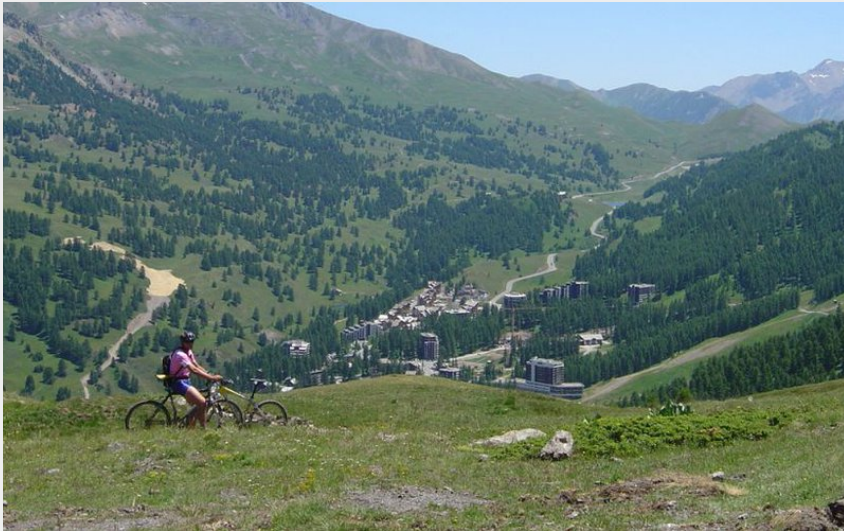
Vue sur la station