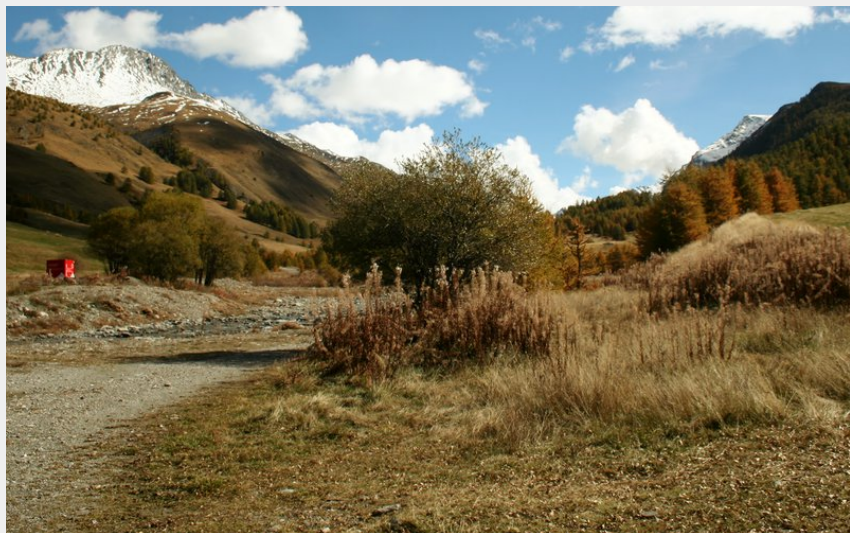
Le haut de l'Aigue Agnel depuis le pont de l'Ariane