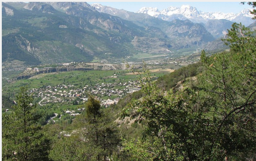
Vue sur la vallée et les Ecrins