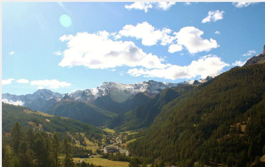
Vallée de l'Aigue Blanche (Benjamin Musella - PNR Queyras)