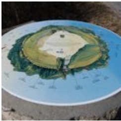
Table d'orientation (J)

Profitez de cette vue dégagée pour découvrir les montagnes alentours et voir les nombreux avions décoller depuis l'aérodrome.