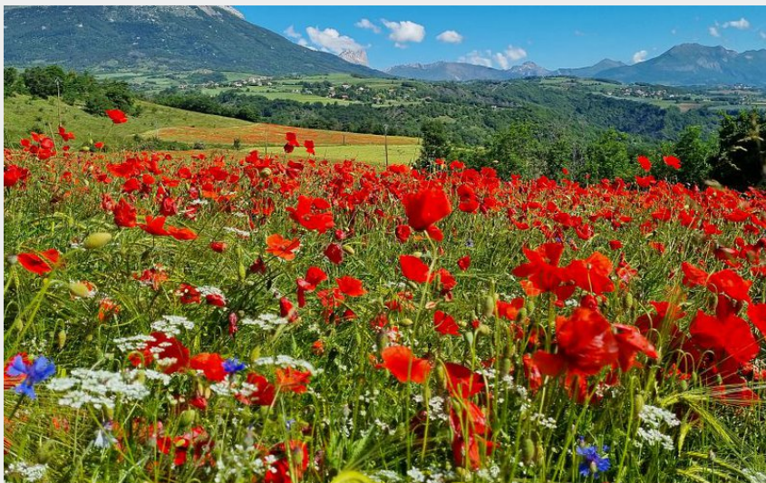
(M Viau/OT GTV)