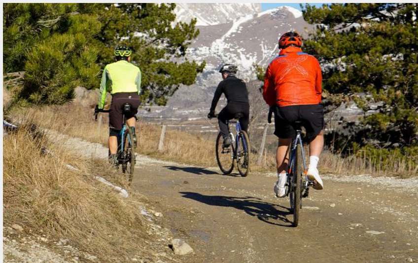
(Eloïse Thomas/OT GTV)