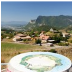
Table d'orientation et point de vue (A)

Sur la route du col de Foureyssasse (1042 m), une table d'orientation offre un magnifique point de vue sur les alentours.