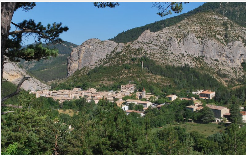
Panorama sur le village d'Orpierre (CCSB)