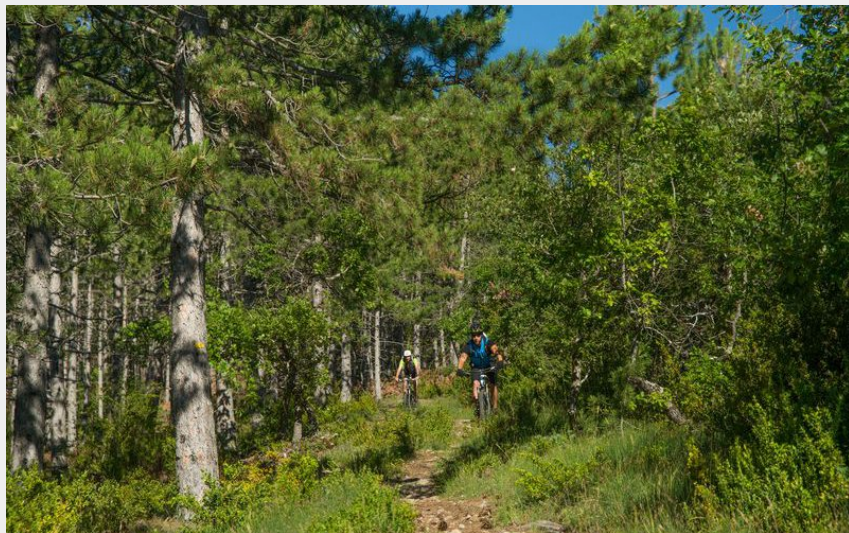
Traversée de la forêt Domaniale de la Méouge à VTT (Espace Rando)