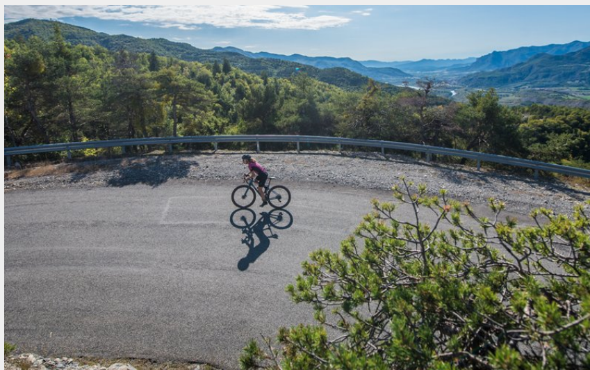
cycliste hautes alpes (analogue)