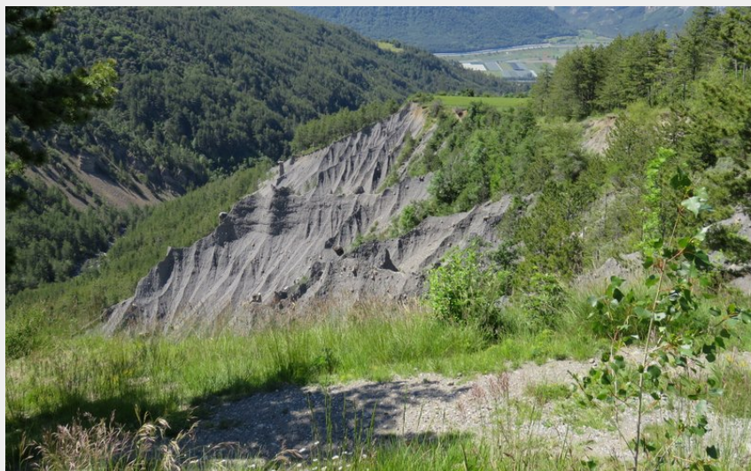
La salle de bal (M. Branchet - CDRP)