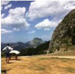
Table d'orientation et panorama (D)

Au collet du Tat, profitez d'une superbe vue sur Le Dévoluy