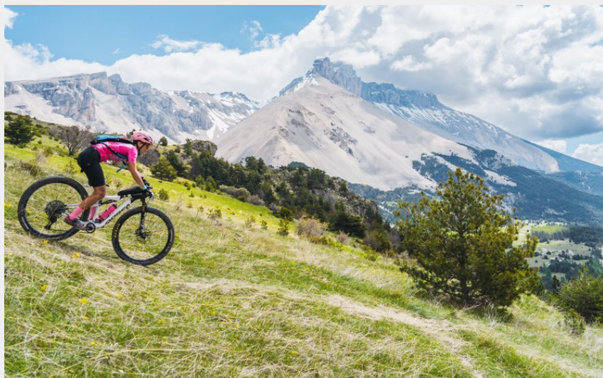
Descente magique sur la Cluse