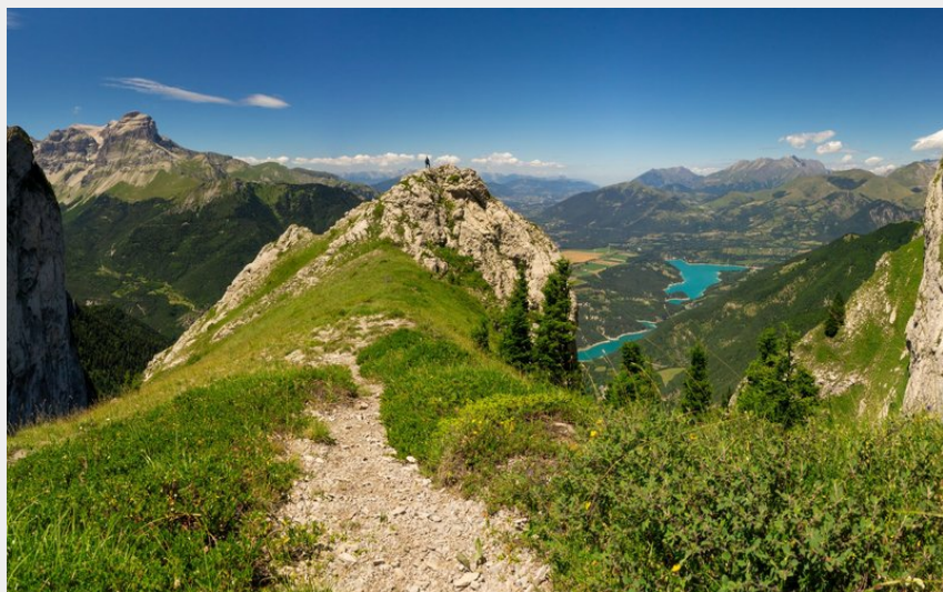
Col de l'Aup (OT Dévoluy)