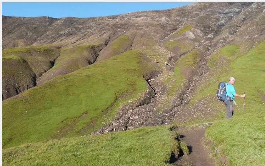
Montée au Col de Vallonpierre (CDRP05)