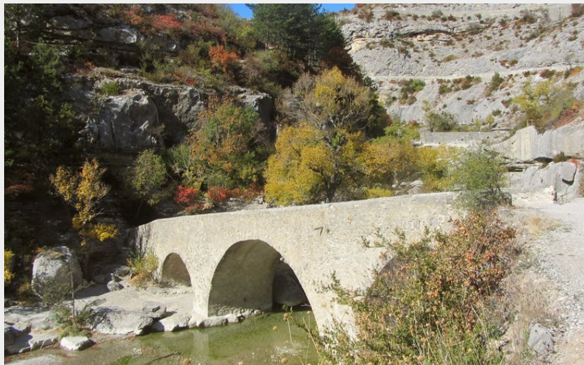
Le Pont Roman traversant la Méouge (CDRP05)