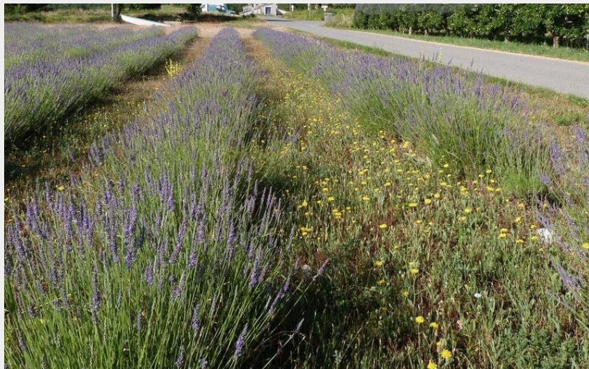
Beaux champs de lavande autour du lieu dit "le Secours" (CDRP05)