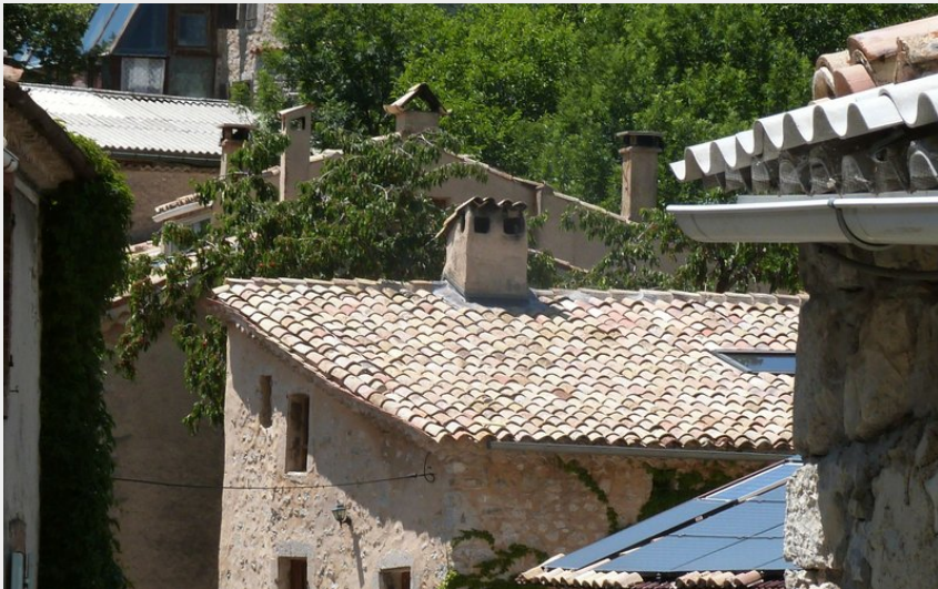
Le charmant village d'Eourres (CDRP05)