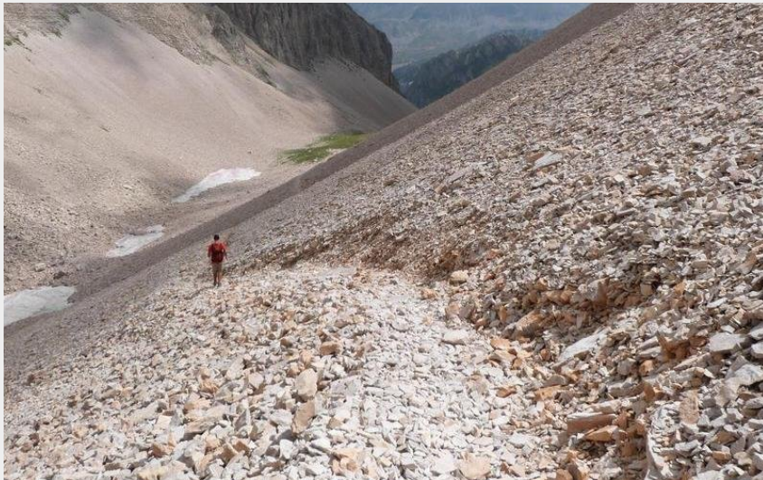
La Combe Ratin (CDRP05)