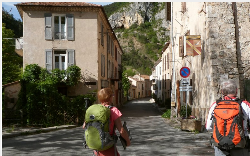
Dans les ruelles du village d'Orpierre (CDRP05)