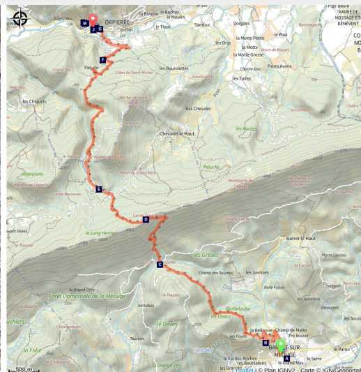
En grimpant juste au dessus de Barret-sur-Méouge (CDRP05)

Cette belle étape, au départ de Barret-sur-Méouge, va mener le randonneur du Val de Méouge jusqu'au secteur d'Orpierre, situé de l'autre côté de la Montagne de Chabre et réputé pour l'escalade sur ses falaises.