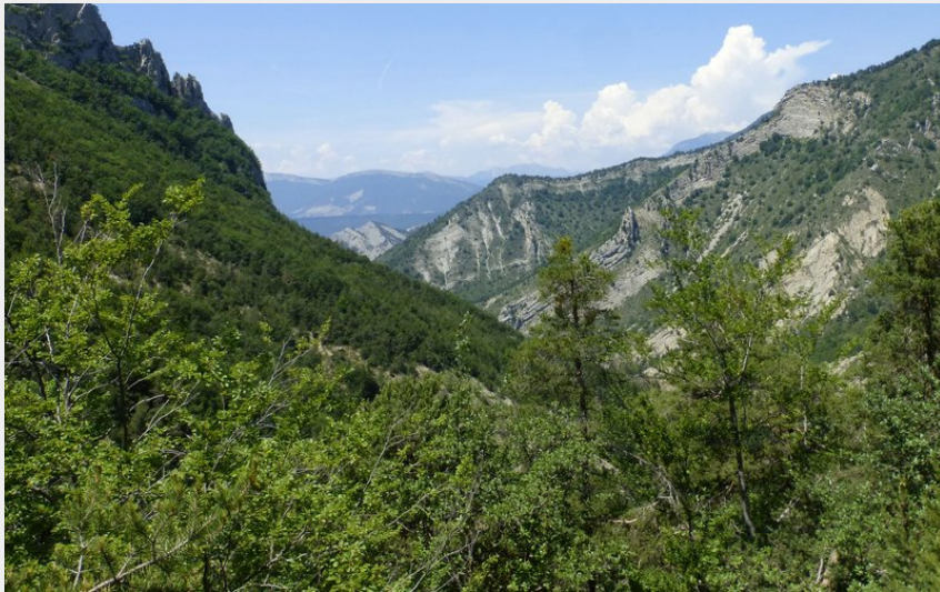
Vallon de Villaret (CDRP05)