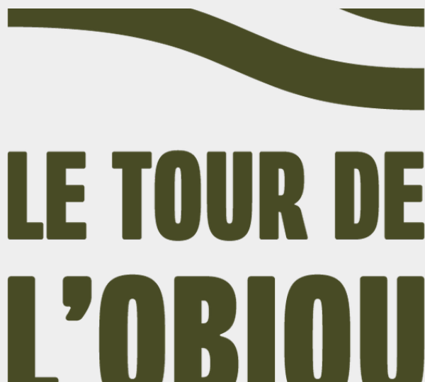
Logo du Tour de l'Obiou