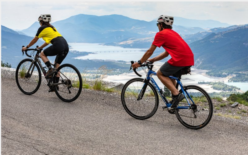
Les Orres