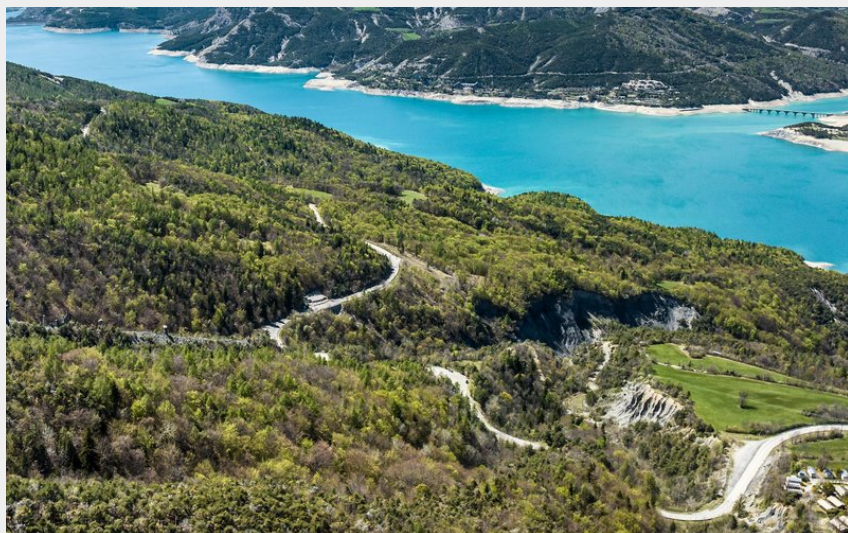
Col de Pontis (OT Serre-Ponçon)