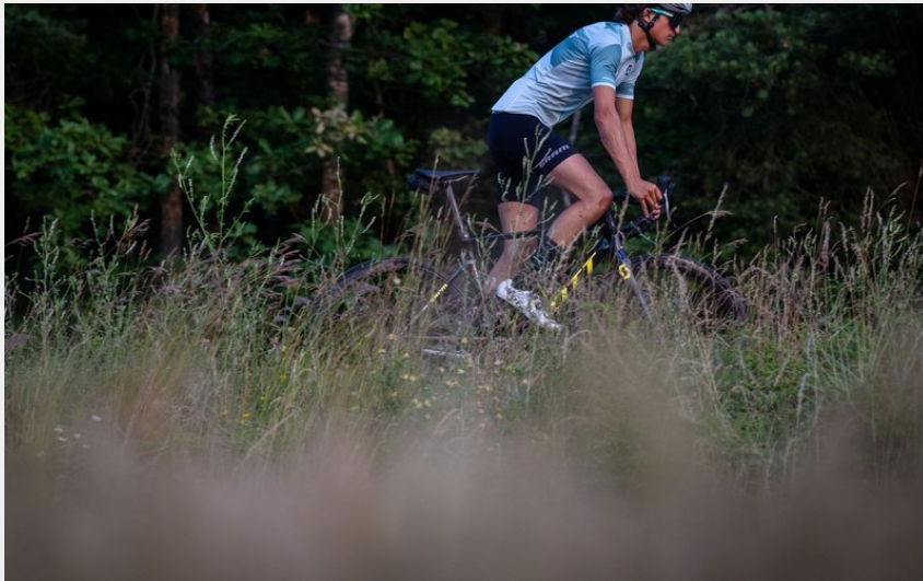
Photo Vélo de route