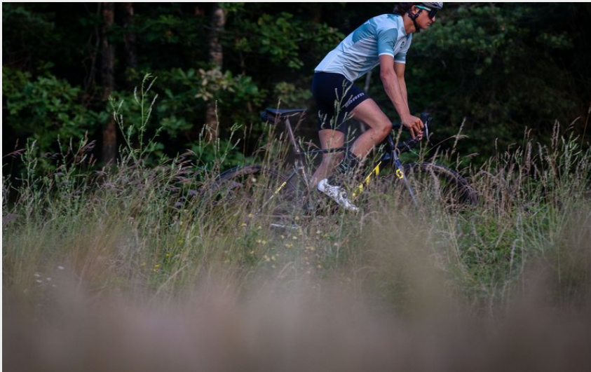
Photo Vélo de route