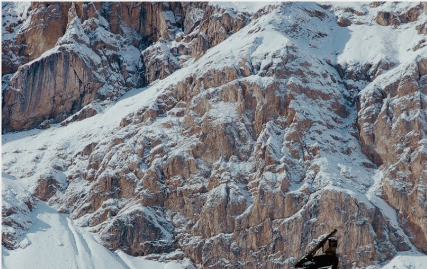
Ruine parmi les chalets d'Izoard