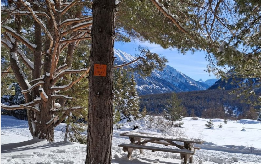
Point de vue depuis l'itinéraire balisé