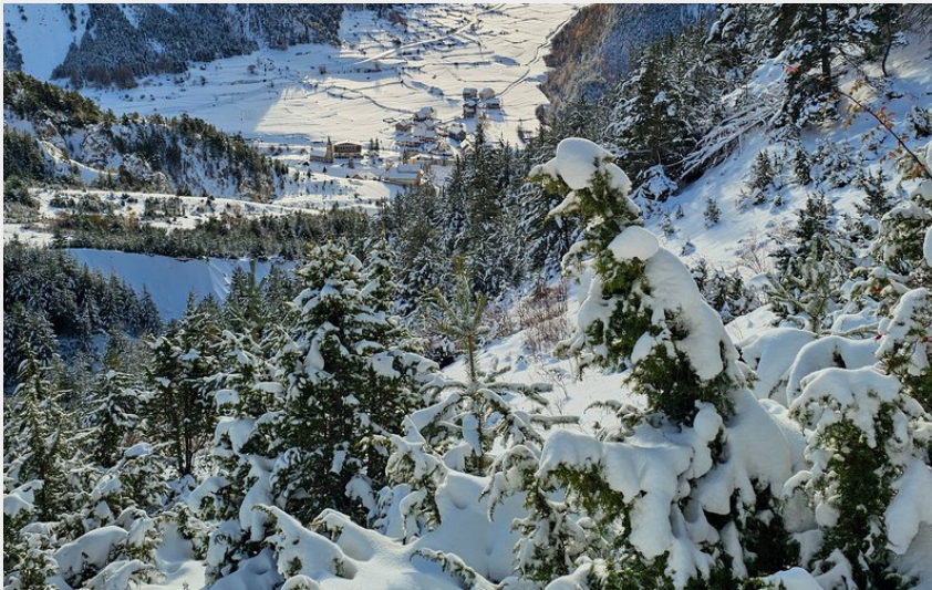
Point de vue depuis les chalets de l'Alp