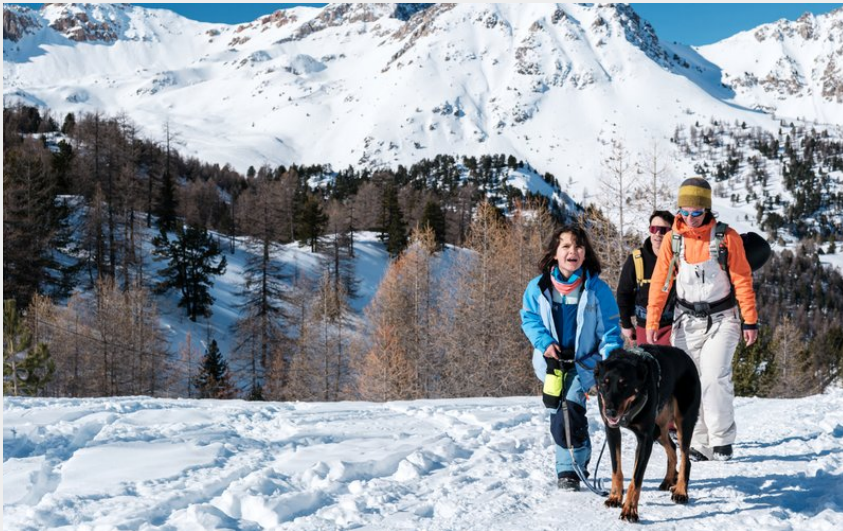
Montée au col de l'Izoard