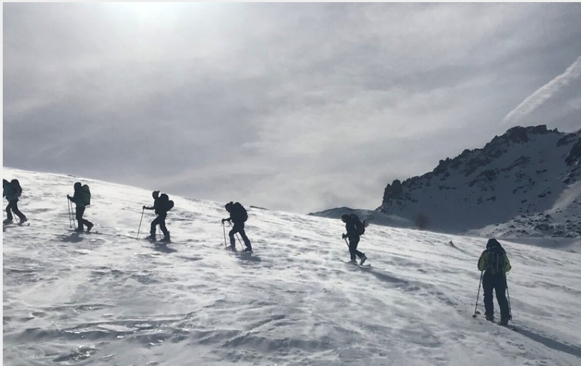
Direction le col de Buffère en ski de randonnée