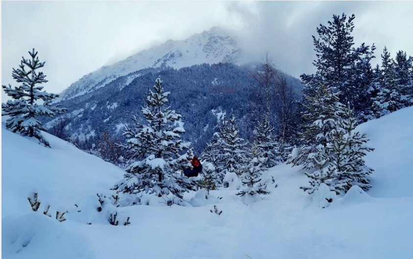
Itinéraire raquettes Arras