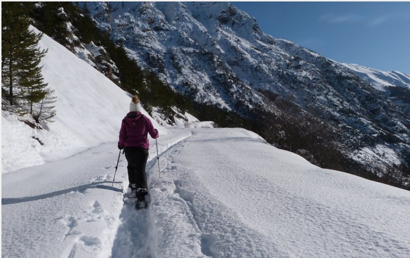
Montée en raquettes au col de l'Echelle