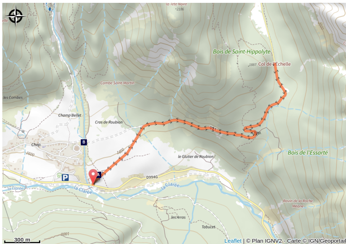
Chapelle St-Hippolyte (A)