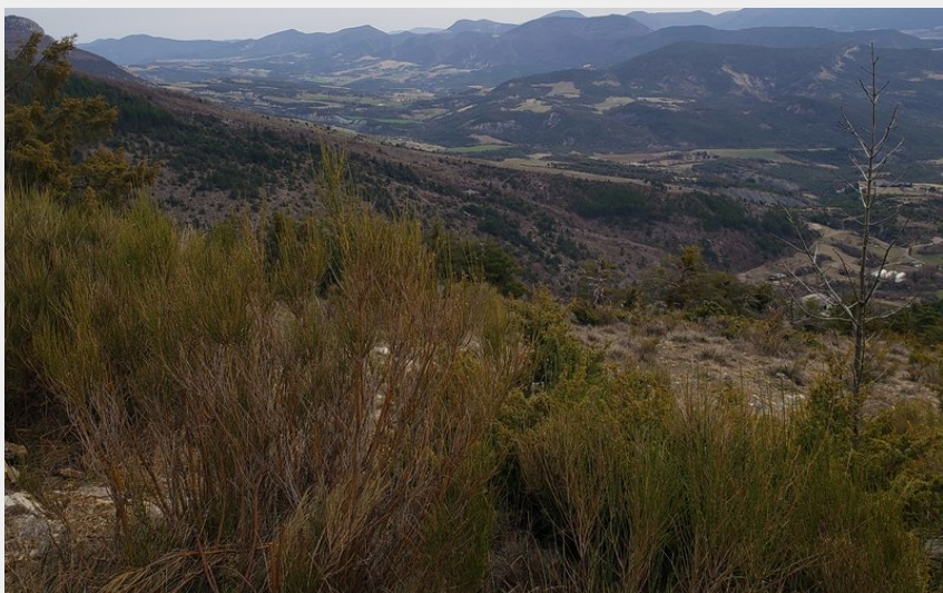
Vue sur la vallée du Rosanais