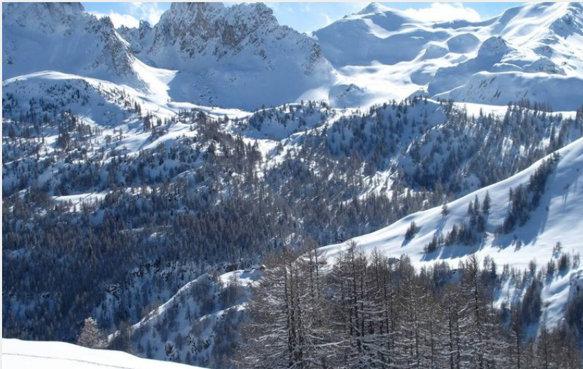
Montée à Ricou (©Ricou)