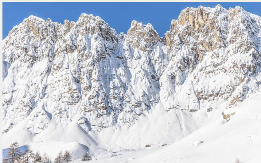
Crêtes au dessus du refuge de Buffère