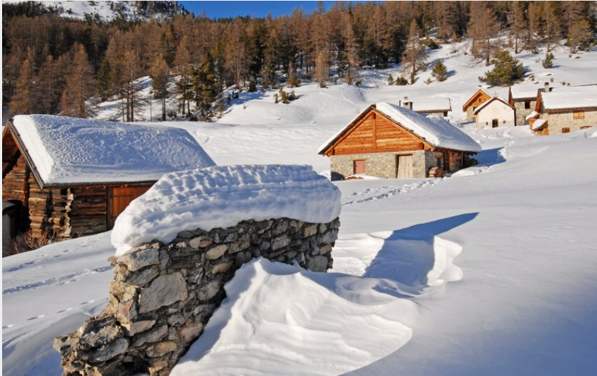
Les chalets des Acles en hiver