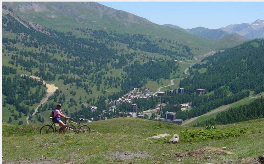
Vue sur la station