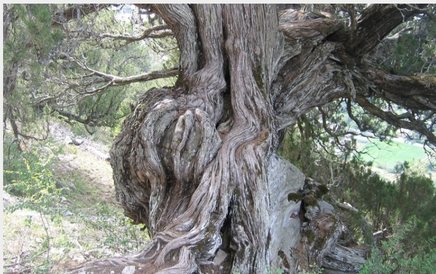
Genévrier Thurifère (T.Gauquelin)