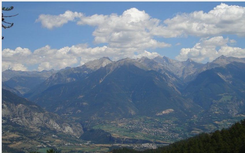
Vue panoramique sur la vallée et le massif de la Font Sancte (CC Guillestrois-Queyras)