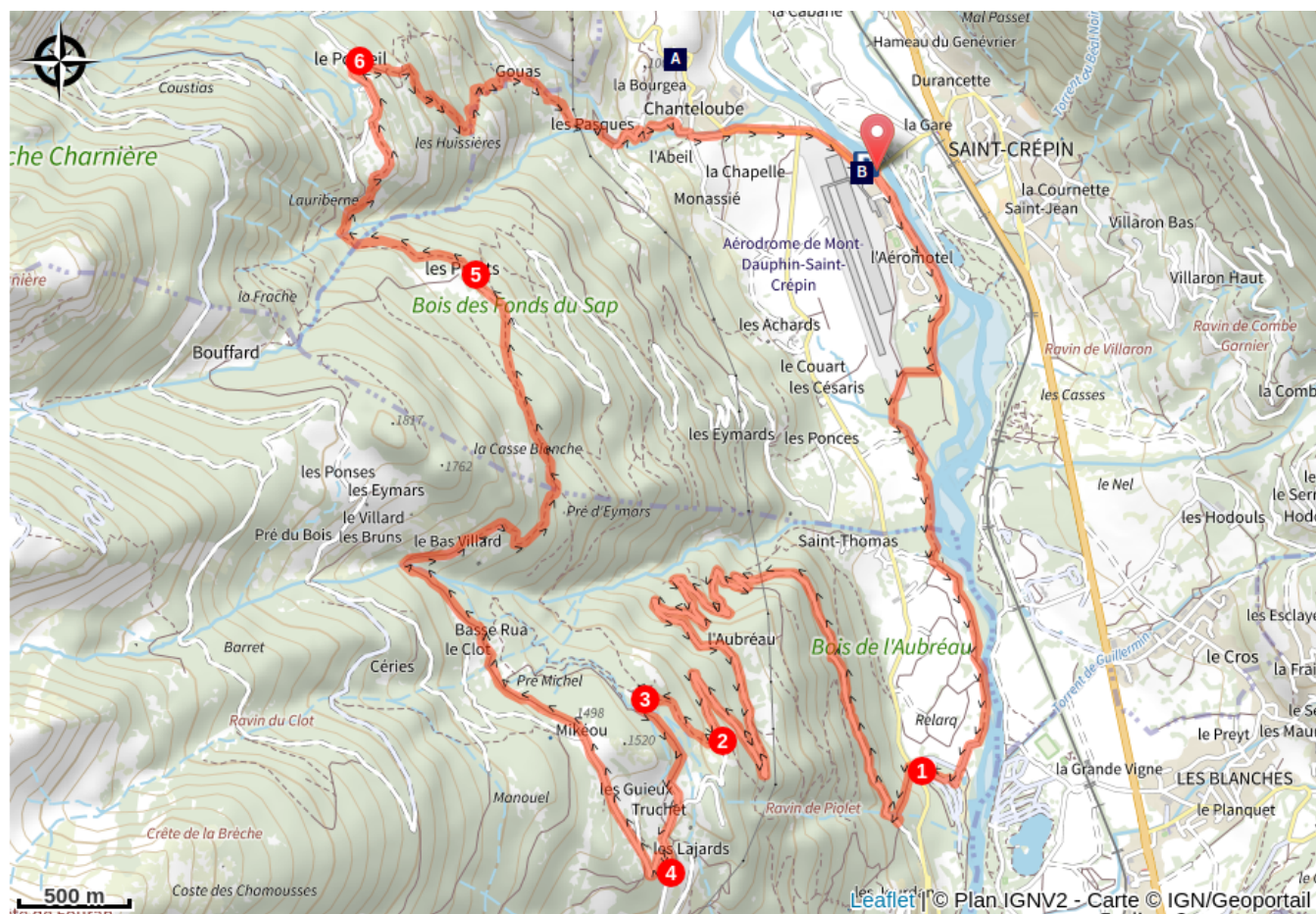
Point de vue (A)