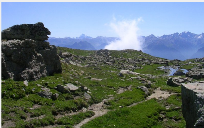
Vallon du torrent de l'Alp