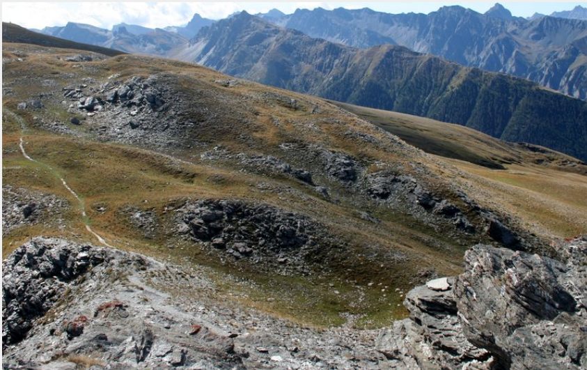
Crête de Batailler depuis le sommet de la Gardiole de l'Alp (Benjamin Musella - PNR Queyras)