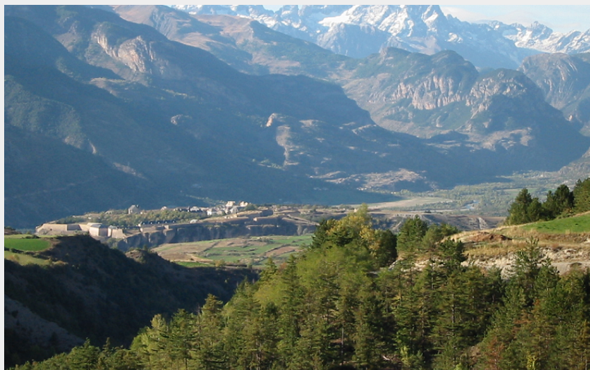
Les plateaux de Guillestre et Mont-Dauphin devant les sommets et glaciers des Ecrins