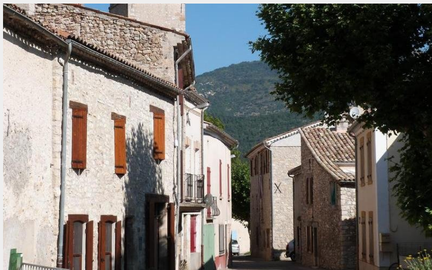
Charmant village de Eygalayes (CDRP05)