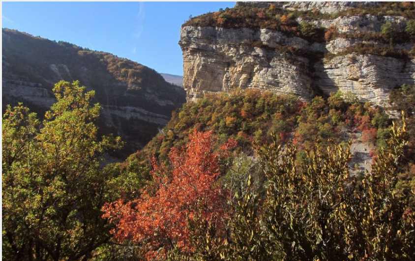
Au coeur des gorges de la Méouge (CDRP05)