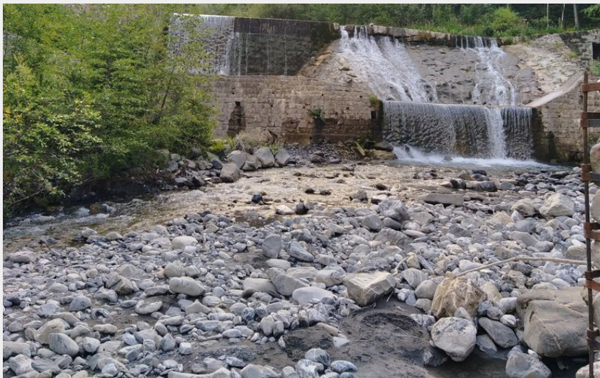
seuil RTM (Etienne Charles)