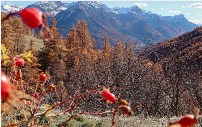
Les Combes