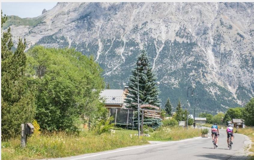
Vélo col du Lautaret