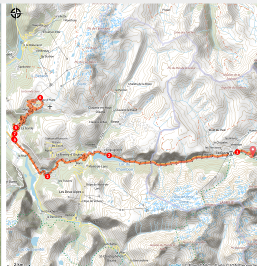
Vélo de Villar d'Arène à Alpe d'Huez

Partez sur les traces du Tour de France ! Ce circuit vous propose d'affronter la mythique ascension de l'Alpe d'Huez avec ses 21 lacets, ses 13.8 km de montée à 7.9%.